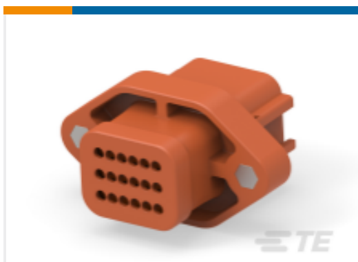
TE 产品编号DTV02-18PD REC, 18P, BRN, N, FLANGE, D