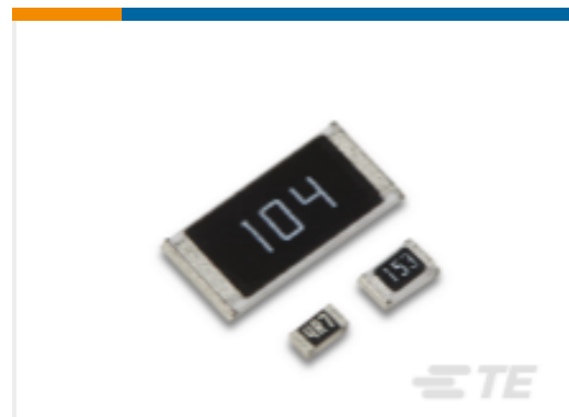
TE 产品编号2-2176345-1 CRGCQ 1210 470R 1%