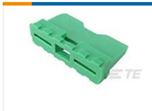
TE 产品编号W12P WEDGE LOCK, 12P, REC, GRN, DT