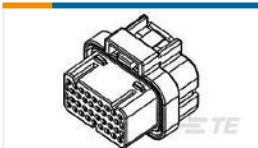
TE 产品编号1473712-2 SUPER SEAL 2ROW 26POS PLUG ASS