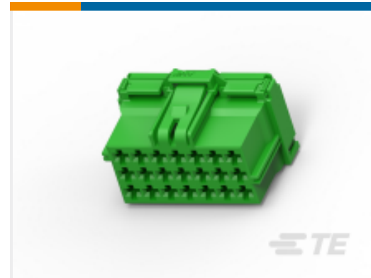
TE 产品编号1534404-2 AMP MCP Unsealed Connector Housings