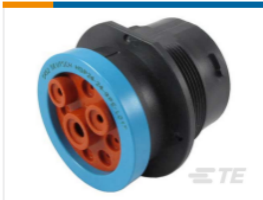
TE 产品编号HDP24-24-9PE-L017 REC, 9P, BLK, E, RNG, 4/8/12, P