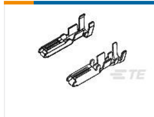
TE 产品编号1-173630-2 070 REC CONTACT GOLD PLATED