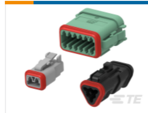
TE 产品编号2298136-1 DEUTSCH DT Plug Connectors