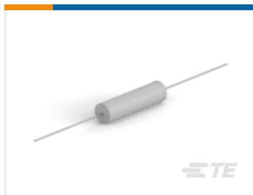
TE 产品编号5-2176414-0 7W STD M/OX 5% 2K2