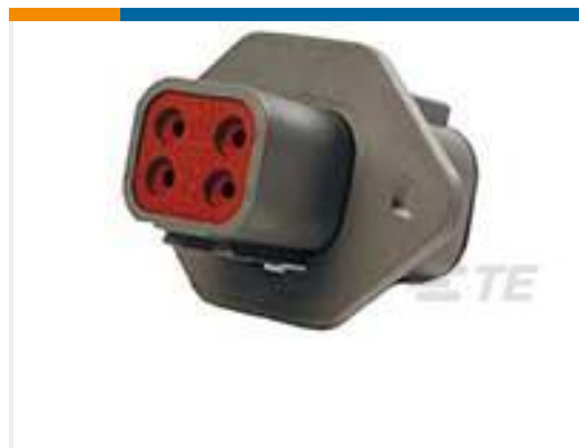
TE 产品编号DTP04-4P-L012 REC, 4P, GRY, N, FLANGE