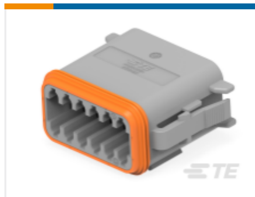
TE 产品编号DT06-12SA PLG, 12P, GRY, N, A