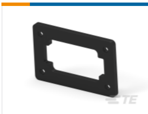
TE 产品编号DT12-L012-GKT GASKET DT 12 WY FLD RC