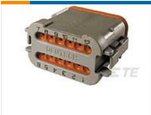
TE 产品编号DT06-12SA-EP04 PLG, 12P, GRY, N, CAP, A