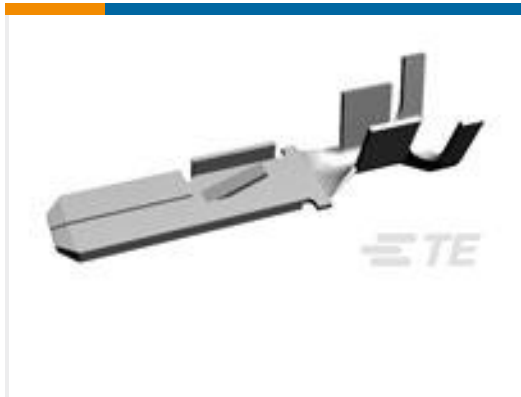
TE 产品编号153303-2 5.16 TAB