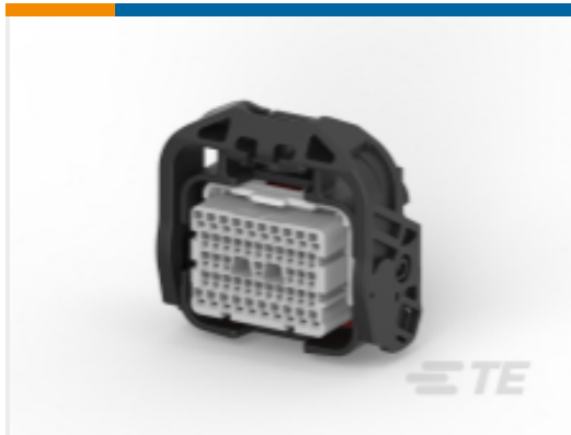
TE 产品编号1747731-2 0.64/1.0 SEALED 49POS PLUG ASSY, B KEY