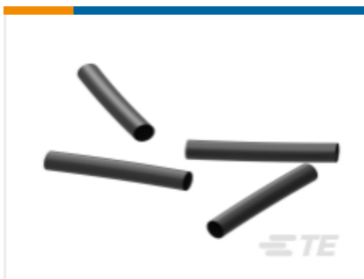
TE 产品编号EK5194-000 ES2000-NO.6-H2-0-39MM