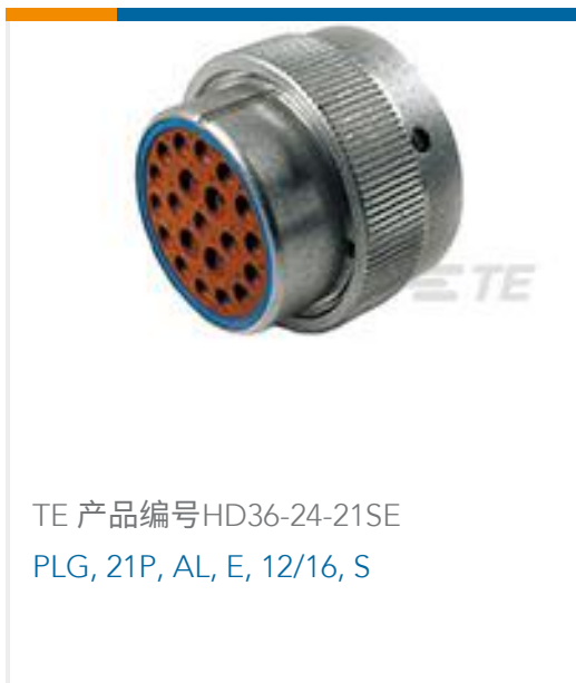
TE 产品编号HD36-24-21SE PLG, 21P, AL, E, 12/16, S