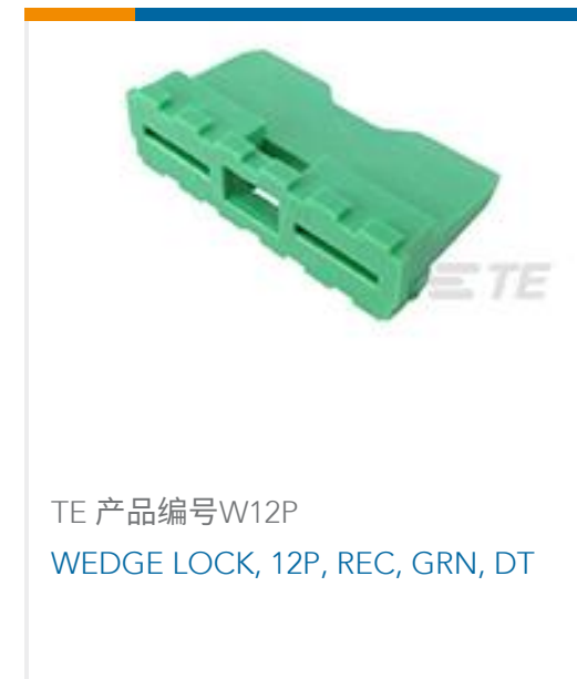
TE 产品编号W12P WEDGE LOCK, 12P, REC, GRN, DT