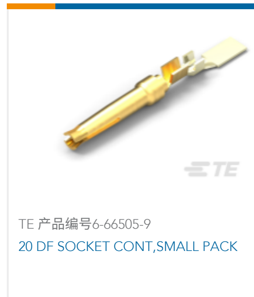
TE 产品编号6-66505-9 20 DF SOCKET CONT,SMALL PACK