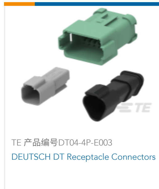
TE 产品编号DT04-4P-E003 DEUTSCH DT Receptacle Connectors