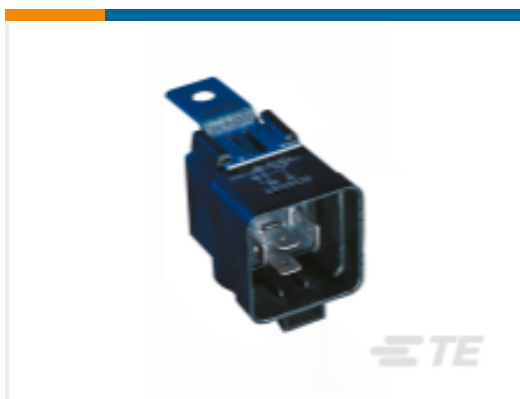
TE 产品编号3-1904131-6 V23134A4064X550-EV-CBOX