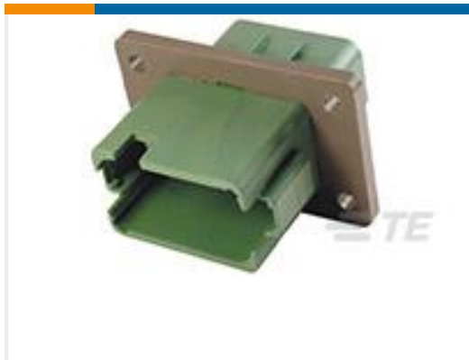
TE 产品编号DT04-12PC-BL04 REC, 12P, GRN, N, ENH KEY, FLANGE, C