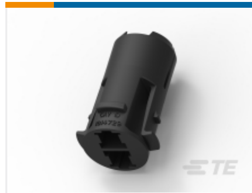
TE 产品编号1814729-4 BULB HOLDER LATCHED