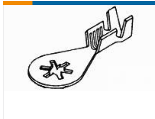
TE 产品编号61795-6 RING 18-14 AWG TPBR