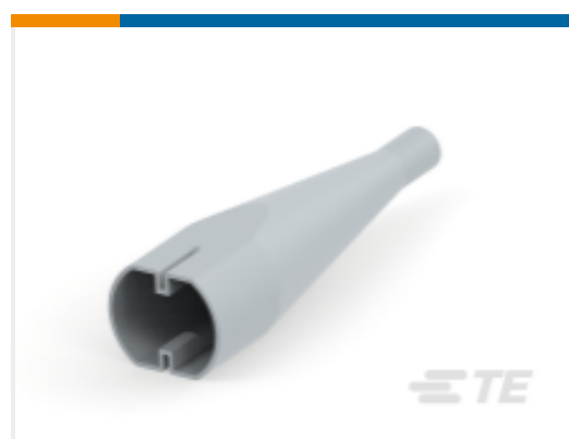
TE 产品编号DT48S-BT BOOT, 48P, PLG, ST, GRY