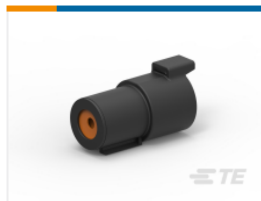
TE 产品编号DTHD04-1-4P-E003 REC, 1P, BLK, N, SIZE 4, CAP