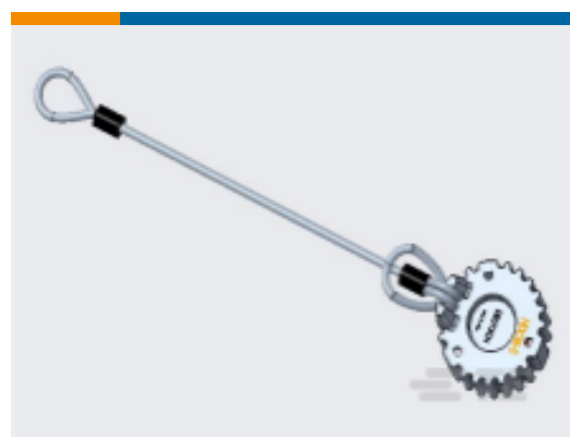
TE 产品编号HDC16-5-LA DUST CAP, 5P, REC, GRY, LANYARD, HD10