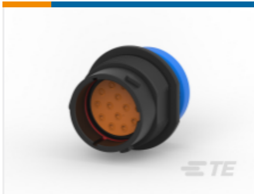
TE 产品编号HDP24-18-14PE-L017 REC, 14P, BLK, E, RNG, 16, P