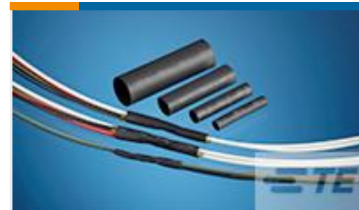
TE 产品编号0146666001 DSPL-NR3-0-65MM