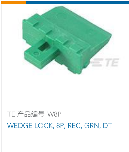
TE 产品编号 W8P WEDGE LOCK, 8P, REC, GRN, DT