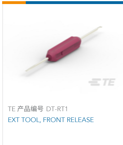
TE 产品编号 DT-RT1 EXT TOOL, FRONT RELEASE