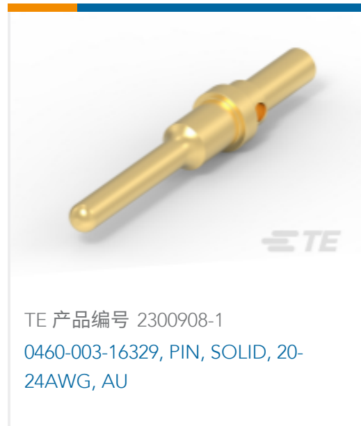
TE 产品编号 2300908-1 0460-003-16329, PIN, SOLID, 20-24AWG, AU