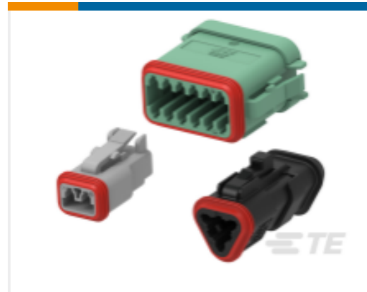
TE 产品编号DT06-12SC-EP06 DEUTSCH DT Plug Connectors