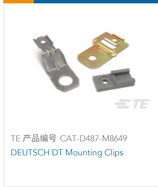
TE 产品编号 CAT-D487-M8649 DEUTSCH DT Mounting Clips