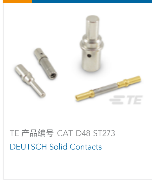
TE 产品编号 CAT-D48-ST273 DEUTSCH Solid Contacts