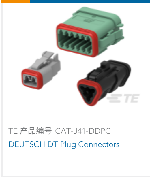
TE 产品编号 CAT-J41-DDPC DEUTSCH DT Plug Connectors