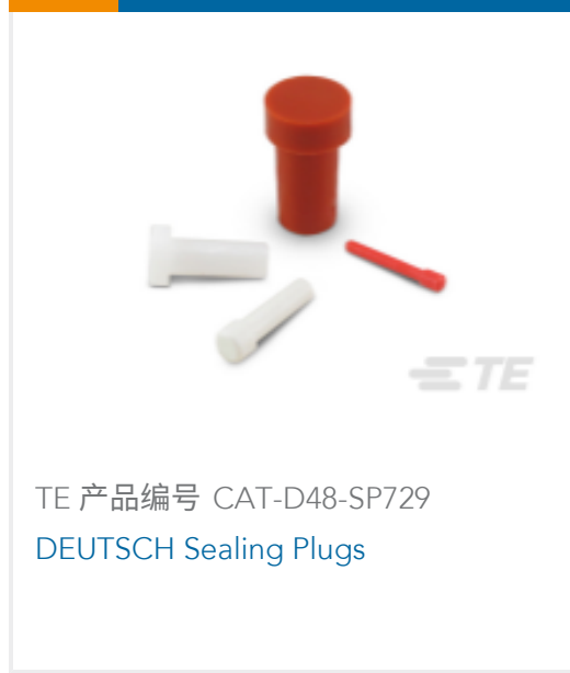
TE 产品编号 CAT-D48-SP729 DEUTSCH Sealing Plugs