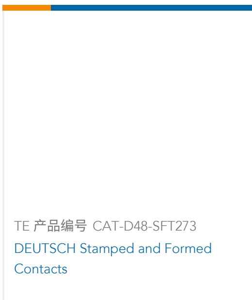
TE 产品编号 CAT-D48-SFT273 DEUTSCH Stamped and Formed Contacts