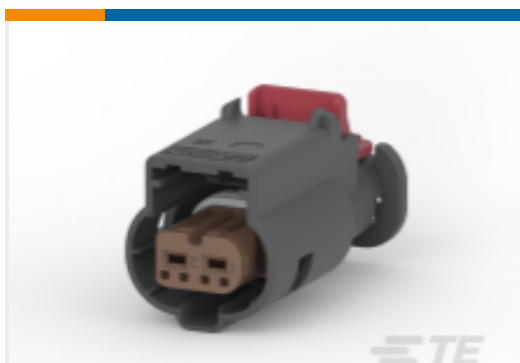
TE 产品编号5-2297790-2 2POS,HPF 1.2,REC HSG,ASSY,SLD