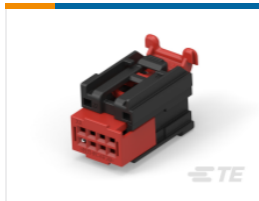
TE 产品编号1456987-1 2x4 Fem unsealed LP assy Key A