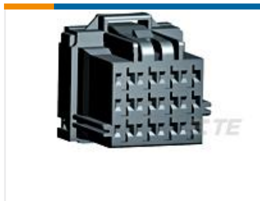
TE 产品编号4-968972-1 MCP2,8 GEH ASSY 12P