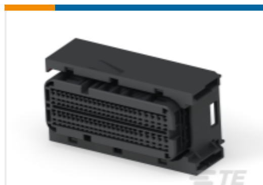
TE 产品编号8-1564284-5 96POS,MCON-1.2 CB,REC HSG,ASSY