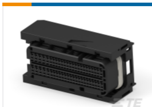
TE 产品编号2359943-2 96POS,MCON-1.2 CB,REC HSG,ASSY