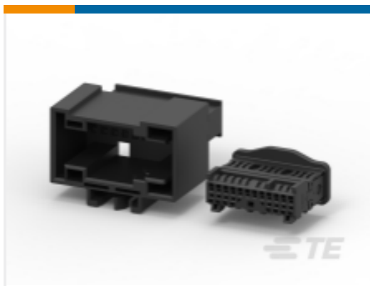
TE 产品编号135526-2 MOS 连接器外壳