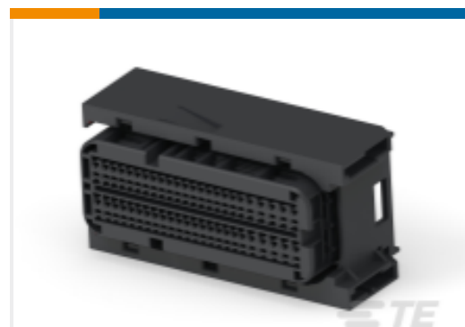
TE 产品编号8-1564284-6 96POS,MCON-1.2 CB,REC HSG,ASSY