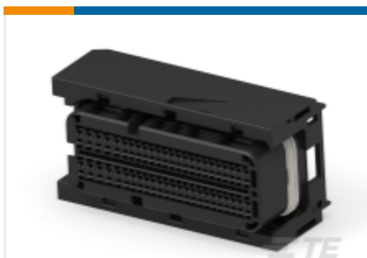
TE 产品编号2359941-6 96POS,MCON-1.2 CB,REC HSG,ASSY