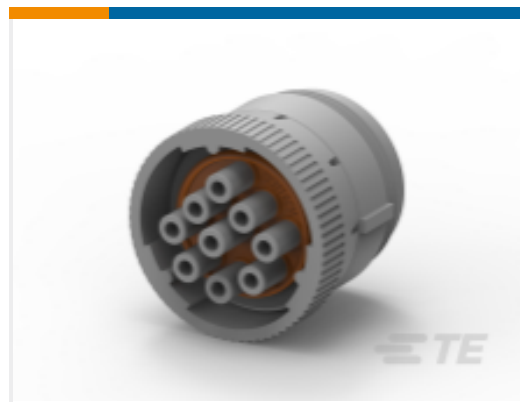
TE 产品编号HD16-9-96SE PLUG ASM