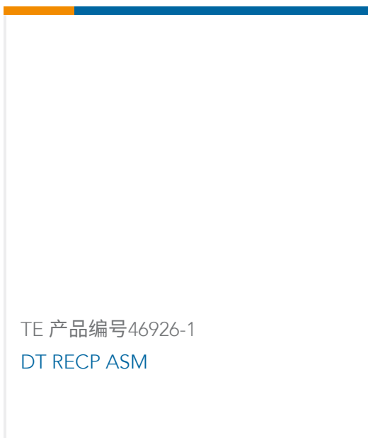
TE 产品编号46926-1 DT RECP ASM