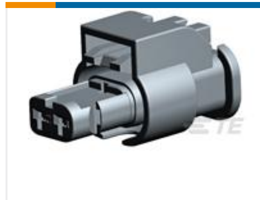
TE 产品编号2-1670916-1 2POS, MCON 1.2 LL REC SEALED