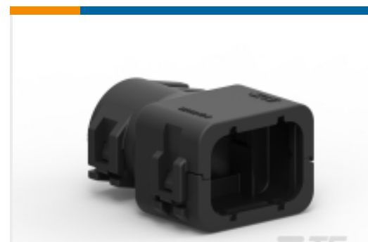
TE 产品编号2292862-3 AS16 BACKSHELL, 4P CAP, NC12, MC