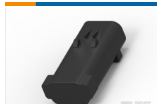
TE 产品编号2040594-2 SEAL CAP HSG 3P, AMPSEAL16 SEA