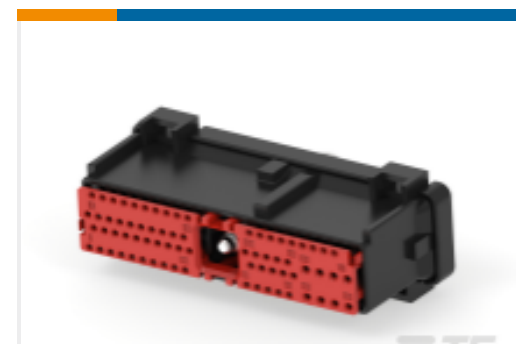
TE 产品编号776315-1 68 POSITION PLUG ASSEMBLY