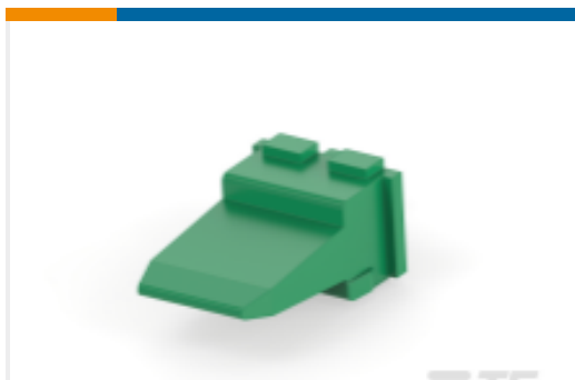
TE 产品编号W4PC WEDGE LOCK, 4P, REC, GRN, DT, C