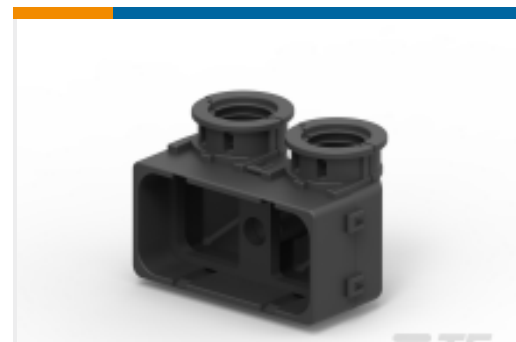
TE 产品编号0528-001-5005 BKSHL, 50P, BLK, PLG, RA, NW 17