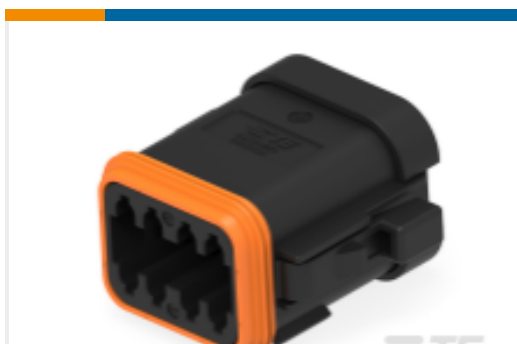
TE 产品编号DT06-08SA-CE11 PLG, 8P, BLK, E, SEAL RET, CAP, A