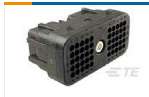
TE 产品编号DRC26-50S08 PLG, 50P, BLK, N, 08