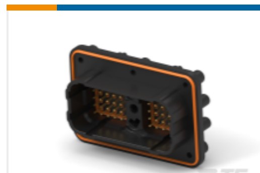
TE 产品编号DRC22-50P07 HDR, 50P, BLK, ST, AU/NI/CU, 07