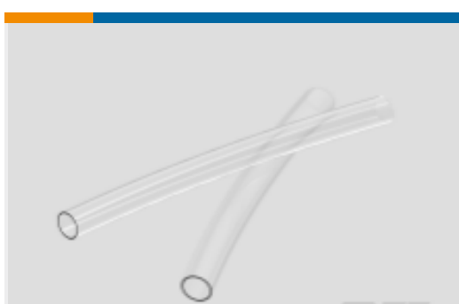
TE 产品编号C34252-000 ES1000-NO.3-B8-X-55MM