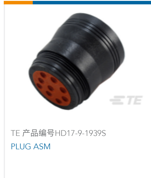
TE 产品编号HD17-9-1939S PLUG ASM