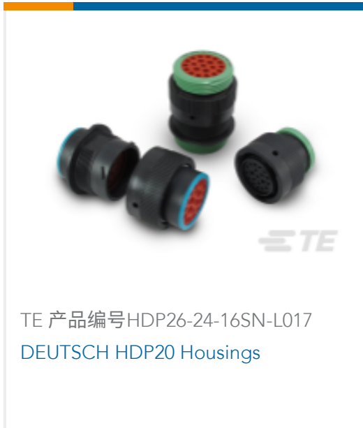
TE 产品编号HDP26-24-16SN-L017 DEUTSCH HDP20 Housings