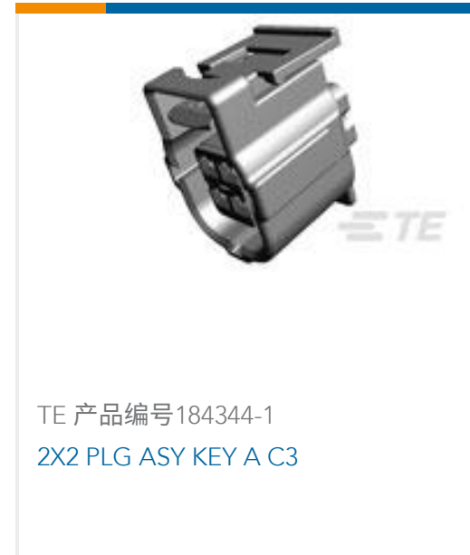
TE 产品编号184344-1 2X2 PLG ASY KEY A C3