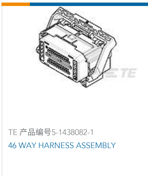
TE 产品编号5-1438082-1 46 WAY HARNESS ASSEMBLY