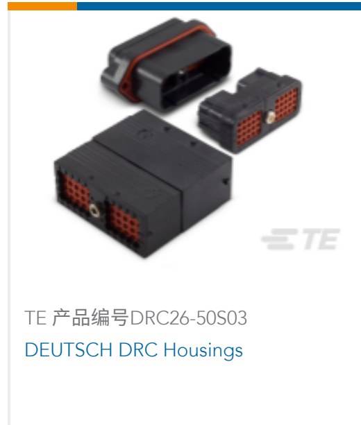
TE 产品编号DRC26-50S03 DEUTSCH DRC Housings