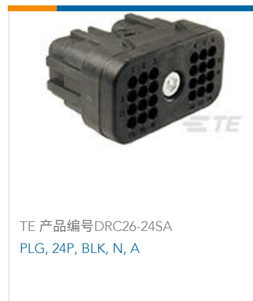
TE 产品编号DRC26-24SA PLG, 24P, BLK, N, A