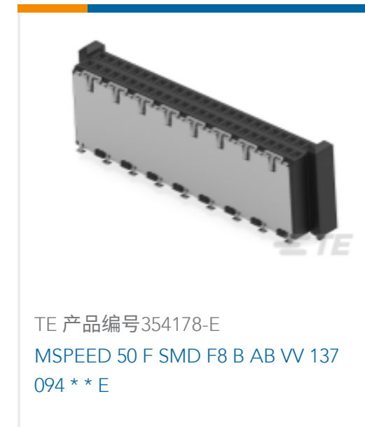
TE 产品编号354178-E MSPEED 50 F SMD F8 B AB W 137 094 ** E