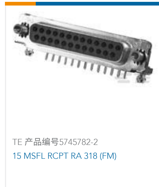
TE 产品编号5745782-2 15 MSFL RCPT RA 318 (FM)