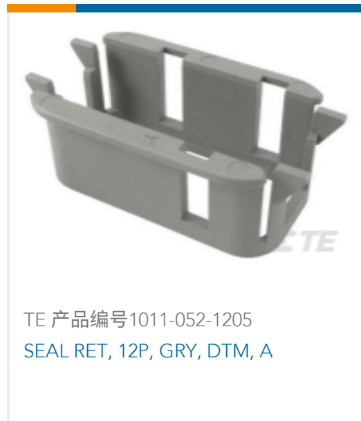
TE 产品编号1011-052-1205 SEAL RET, 12P, GRY, DTM, A