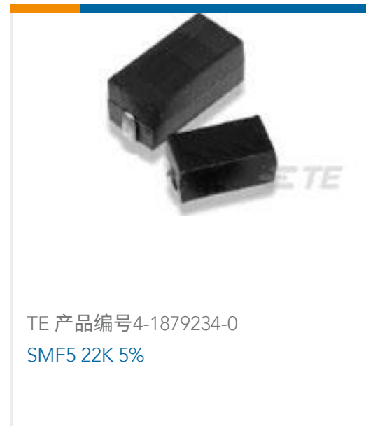
TE 产品编号4-1879234-0 SMF5 22K 5%