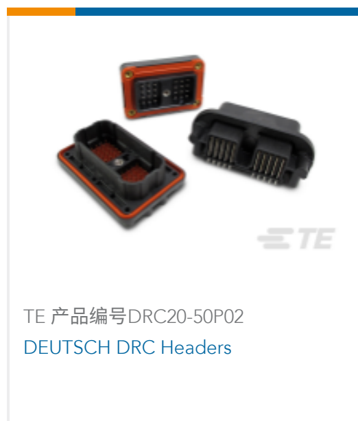
TE 产品编号DRC20-50P02 DEUTSCH DRC Headers