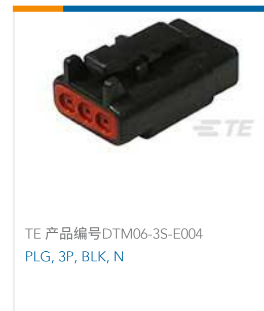
TE 产品编号DTM06-3S-E004 PLG, 3P, BLK, N