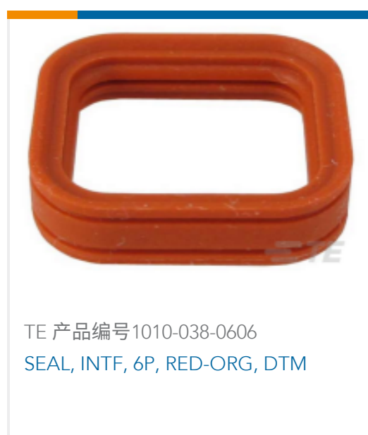
TE 产品编号1010-038-0606 SEAL, INTF, 6P, RED-ORG, DTM