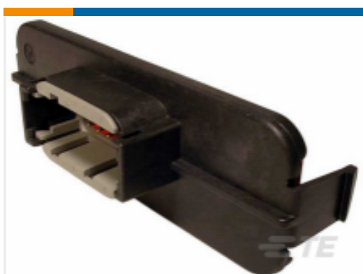
TE 产品编号DTM13-12PA-GR01 HDR, 12P, BLK, RA EEC, AU/NI/CU, A