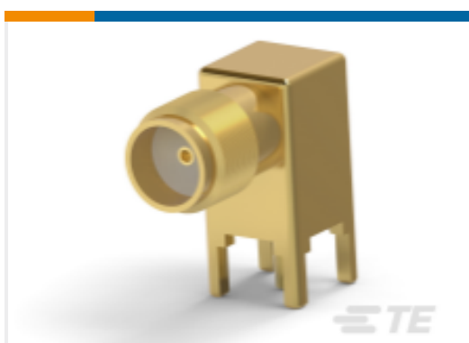
TE 产品编号5-1814400-2 SMA R/A PCB Skt GZD