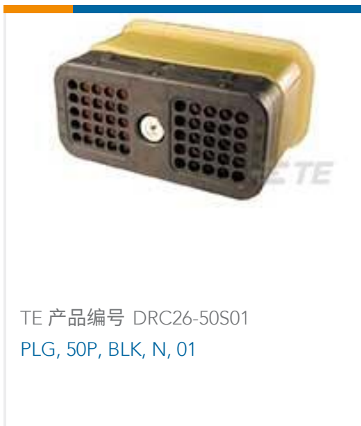
TE 产品编号 DRC26-50S01 PLG, 50P, BLK, N, 01