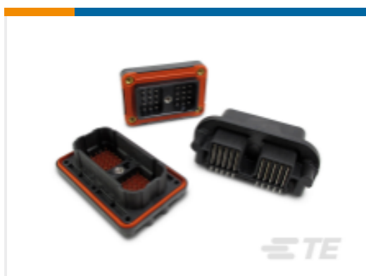
TE 产品编号DRC13-24PA-CG01 DEUTSCH DRC Headers