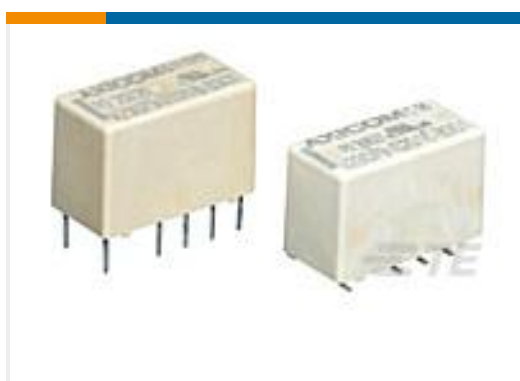
TE 产品编号1393788-3 V23079A1001B301