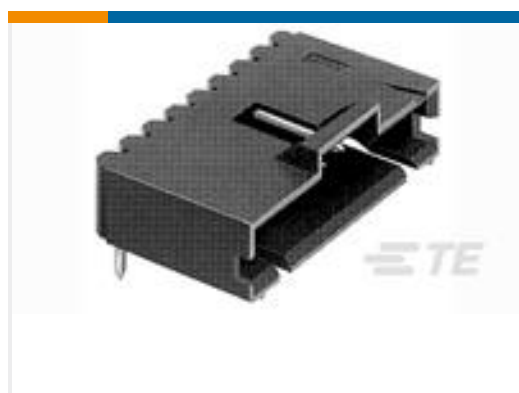
TE 产品编号6-103635-3 14 MTE HDR SRRA LTCH.100CL LF