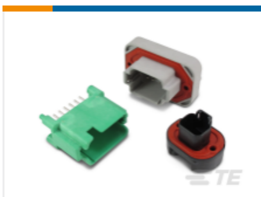
TE 产品编号DT13-12PA DEUTSCH DT Headers