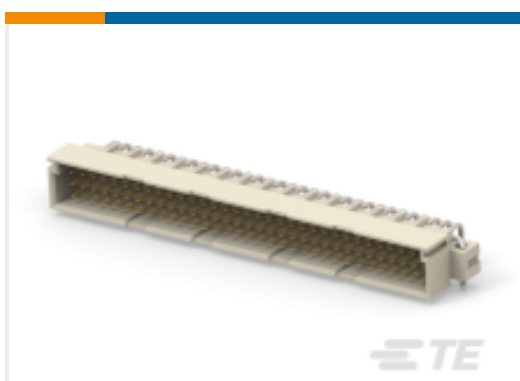
TE 产品编号374546-E STVC 96 M ABC VVW 4-00 0606 ** 247 E007