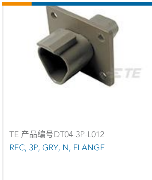
TE 产品编号DT04-3P-L012 REC, 3P, GRY, N, FLANGE