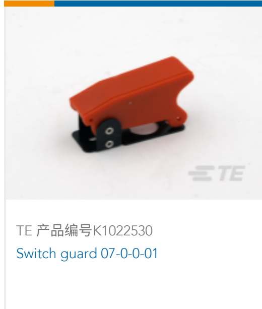
TE 产品编号K1022530 Switch guard 07-0-0-01