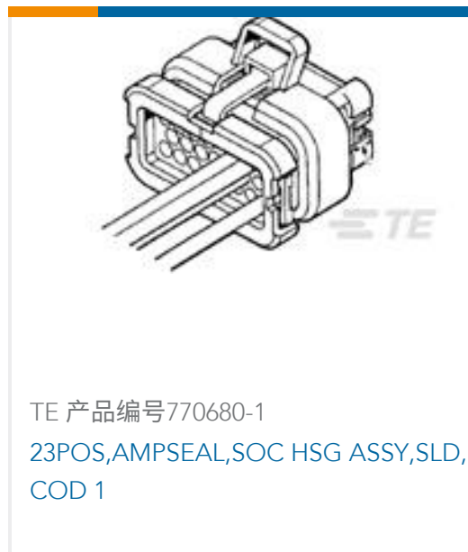
TE 产品编号770680-1 23POS, AMPSEAL, SOC HSG ASSY, SLD, COD 1