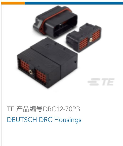
TE 产品编号DRC12-70PB DEUTSCH DRC Housings