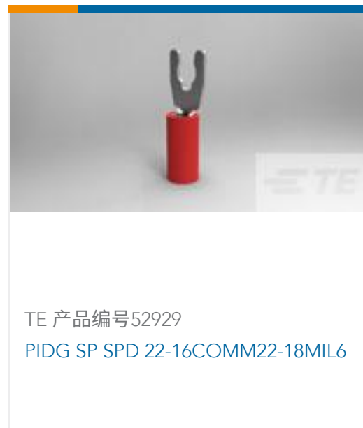
TE 产品编号52929 PIDG SP SPD 22-16COMM22-18MIL6 COD 1