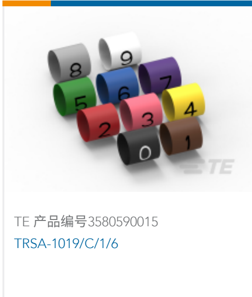
TE 产品编号3580590015 TRSA-1019/C/1/6