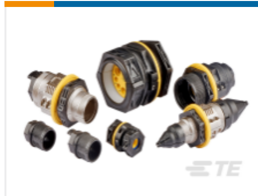
TE 产品编号ZPF000000000097665 D-EASY 03 B