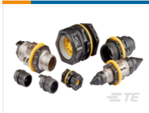
TE 产品编号ZPF000000000097664 D-EASY 03 A