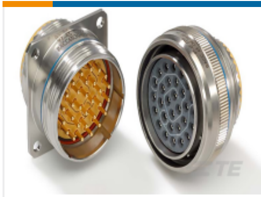
TE 产品编号ZPF200000000008816 983-6SE 12-12 SN-L