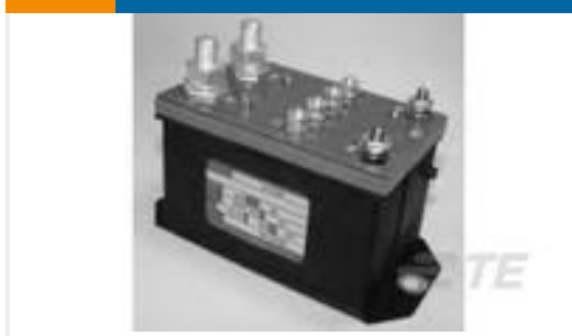
TE 产品编号1616058-6 A703CD (FAA/PMA)=RELAY