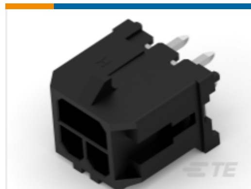
TE 产品编号1-2204801-8 ELCON MICRO,HEADER,VERTICAL DIP,4P