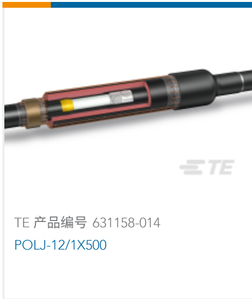
TE 产品编号 631158-014 POLJ-12/1X500