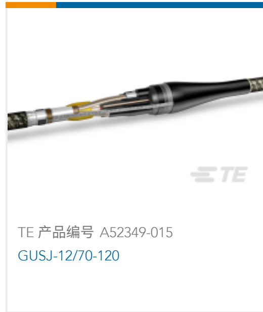
TE 产品编号 A52349-015 GUSJ-12/70-120