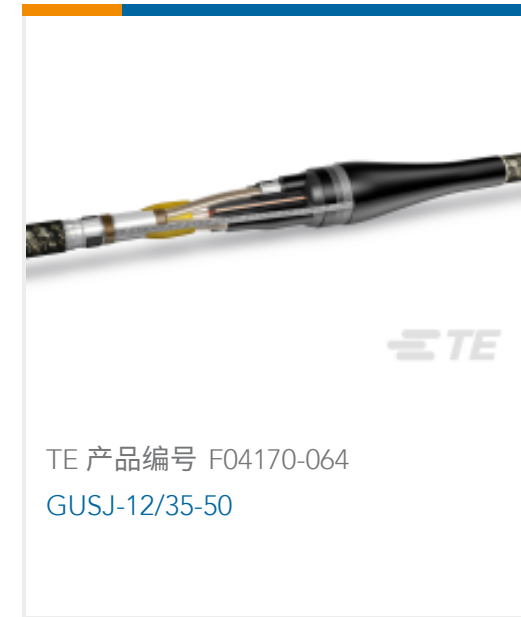
TE 产品编号 F04170-064 GUSJ-12/35-50