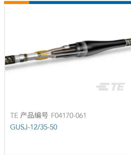
TE 产品编号 F04170-061 GUSJ-12/35-50