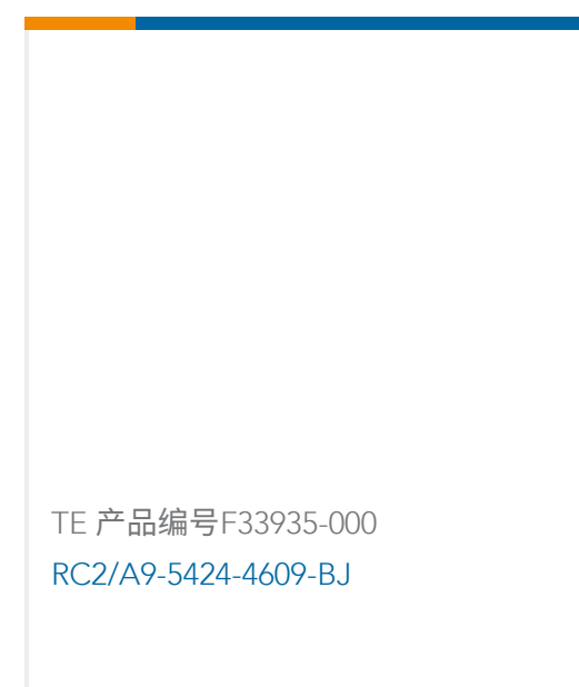
TE 产品编号F33935-000 RC2/A9-5424-4609-BJ