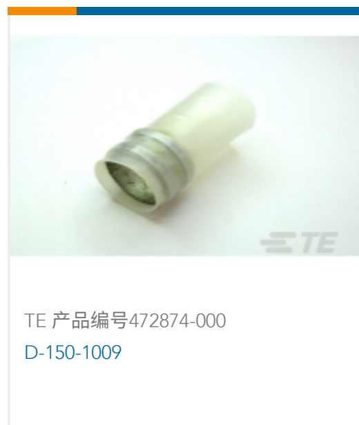
TE 产品编号472874-000 D-150-1009