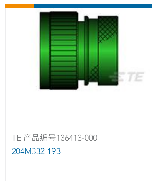
TE 产品编号136413-000 204M332-19B