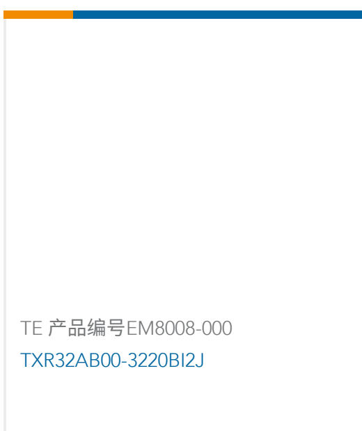
TE 产品编号EM8008-000 TXR32AB00-3220BI2J