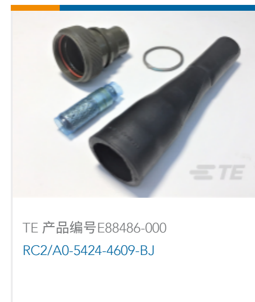
TE 产品编号E88486-000 RC2/A0-5424-4609-BJ