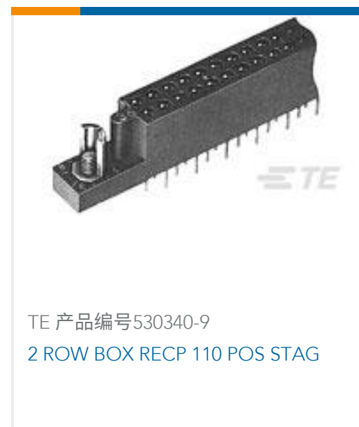
TE 产品编号530340-9 2 ROW BOX RECP 110 POS STAG