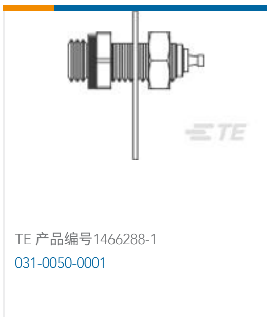
TE 产品编号1466288-1 031-0050-0001