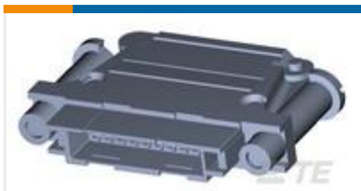
TE 产品编号E40308-000 MTCQKT1P2PFCC