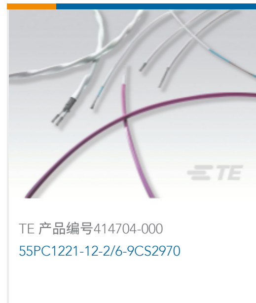
TE 产品编号414704-000 55PC1221-12-2/6-9CS2970