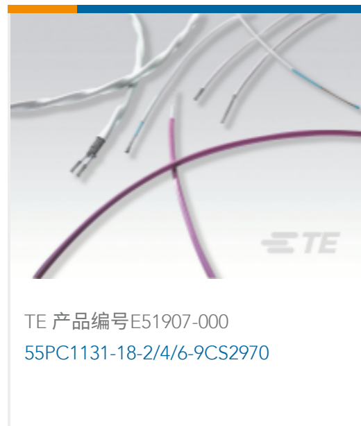
TE 产品编号E51907-000 55PC1131-18-2/4/6-9CS2970