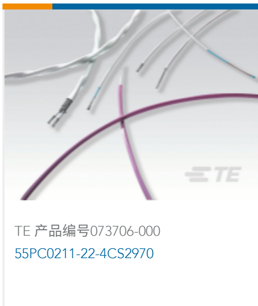
TE 产品编号073706-000 55PC0211-22-4CS2970