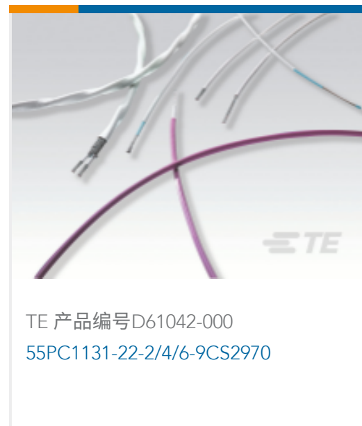
TE 产品编号D61042-000 55PC1131-22-2/4/6-9CS2970