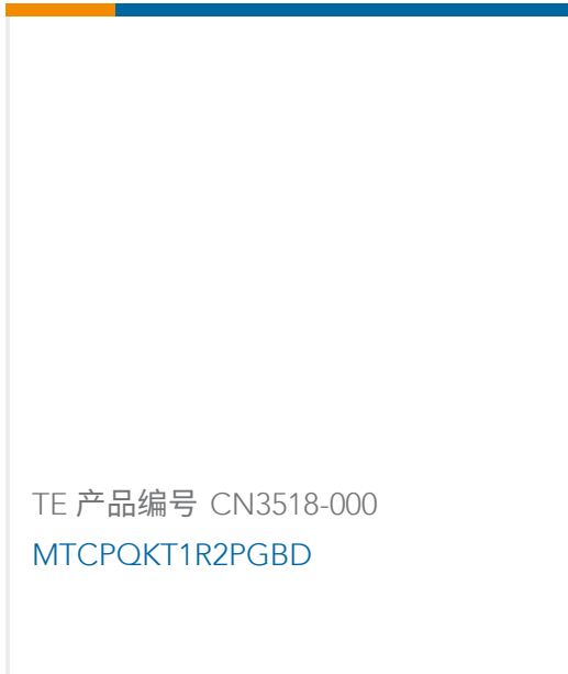
TE 产品编号 CN3518-000 MTCPOKT1R2PGBD