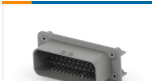
TE 产品编号776180-4 35POS,PIN DIA 1.3,HDR ASSY,90DEG, COD 4