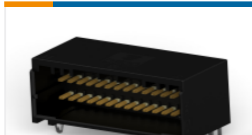
TE 产品编号1-2271888-5 DYNAMIC 1100D HDR ASSY H 30P XBLACK TIN