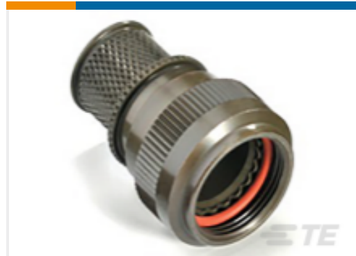
TE 产品编号BTH1-15-08-1-ZN BTH1-15-08-1-ZN