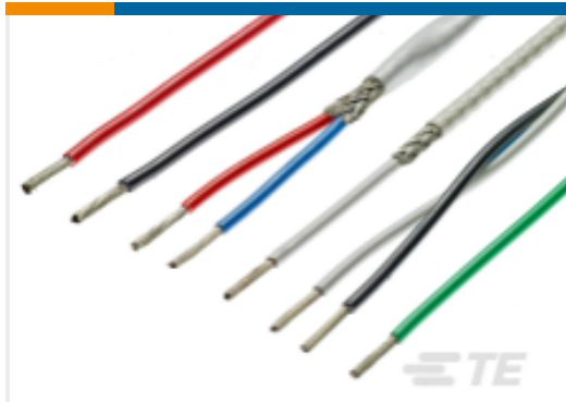
TE 产品编号109761-000 44A0141-20-9/90/92/96