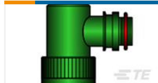
TE 产品编号CS0143-000 TXR40SJ90-2418BI