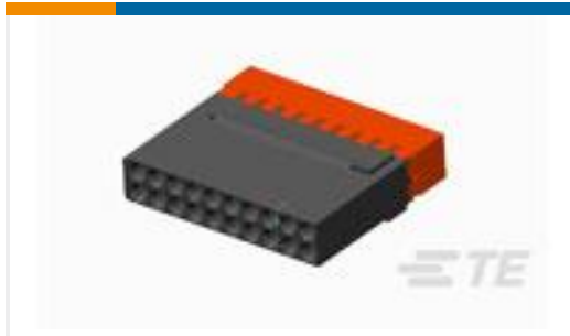
TE 产品编号253627-000 MTC100-BF2-P21