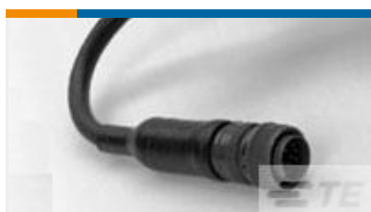
TE 产品编号5660054001 SFR-3/4-0-SP