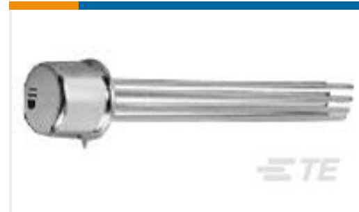
TE 产品编号2-1617118-0 J1MACD-26XM = M39016/23-030M