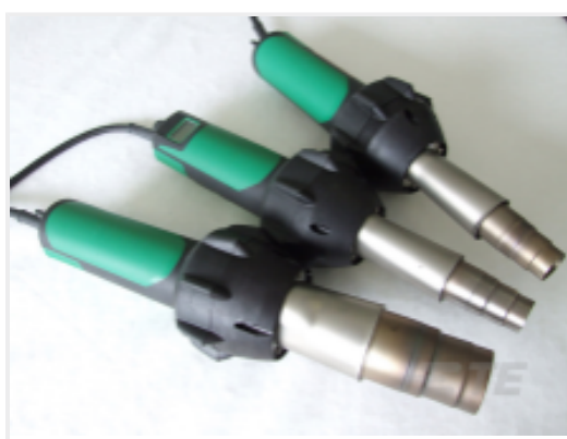
TE 产品编号 EG1114-000 CV1981-ST-230V1600W-EU