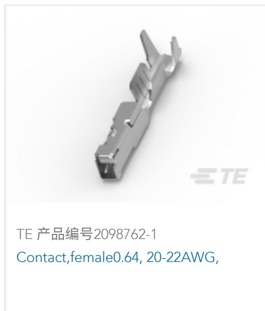
TE 产品编号2098762-1 Contact,female0.64, 20-22AWG,