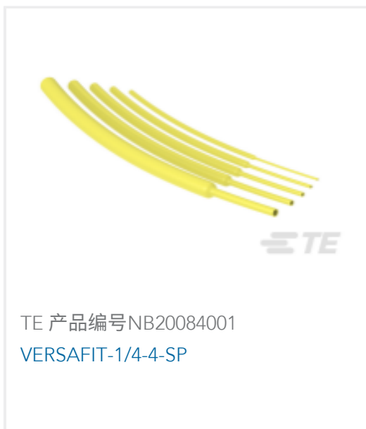
TE 产品编号NB20084001 VERSAFIT-1/4-4-SP