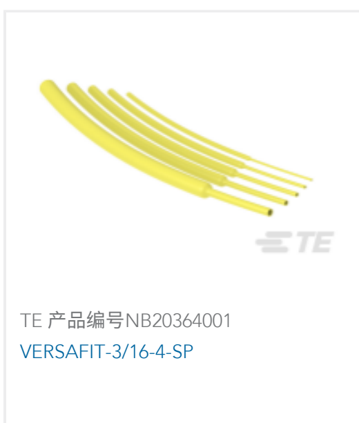
TE 产品编号NB20364001 VERSAFIT-3/16-4-SP