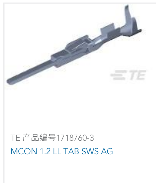
TE 产品编号1718760-3 MCON 1.2 LL TAB SWS AG