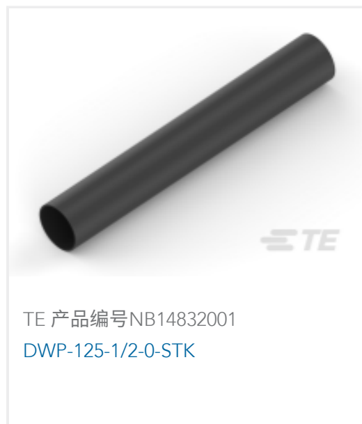
TE 产品编号NB14832001 DWP-125-1/2-0-STK