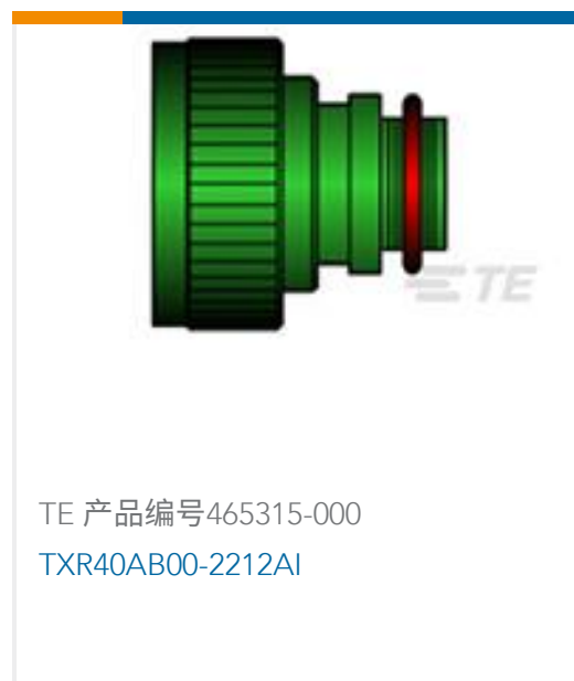
TE 产品编号465315-000 TXR40AB00-2212AI