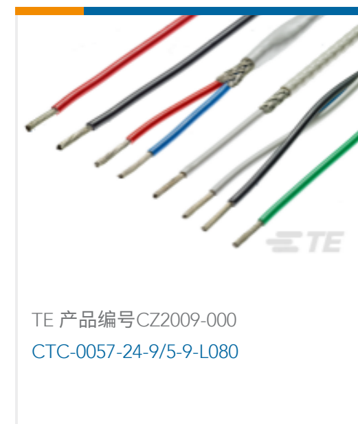
TE 产品编号CZ2009-000 CTC-0057-24-9/5-9-L080