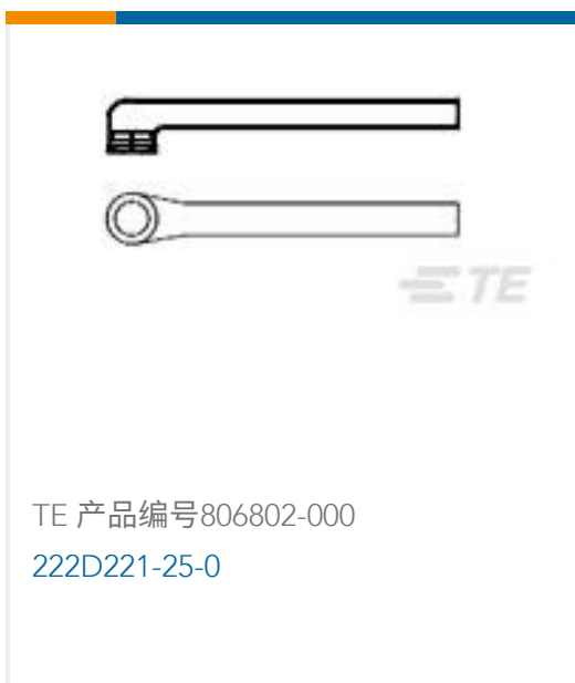
TE 产品编号806802-000 222D221-25-0