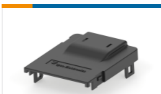
TE 产品编号1986186-1 Strain Relief,20 Posn,D3000 Dynamic, 2