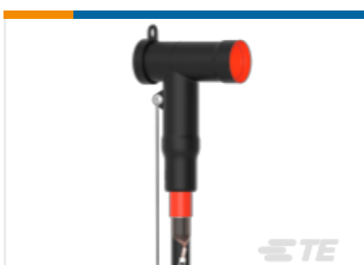
TE 产品编号CM0012-072 屏蔽式可分离连接器 1250 A