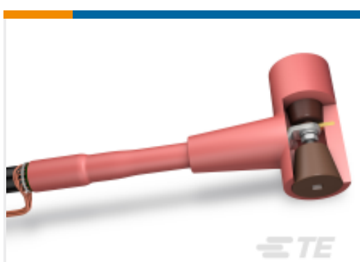
TE 产品编号555340-070 RICS-5123