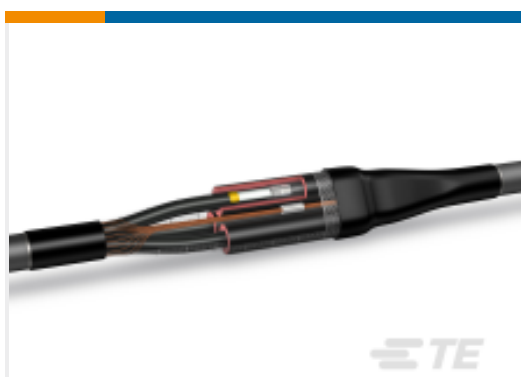
TE 产品编号D11309-070 POLJ-12/3X25-70