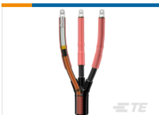
TE 产品编号E92435-063 POLT-12D/3XIH1