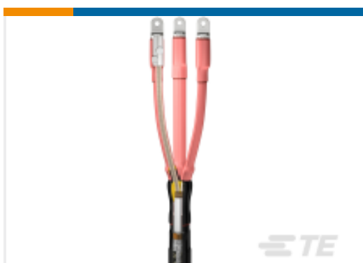
TE 产品编号C47372-064 GUST-12/25-50/800