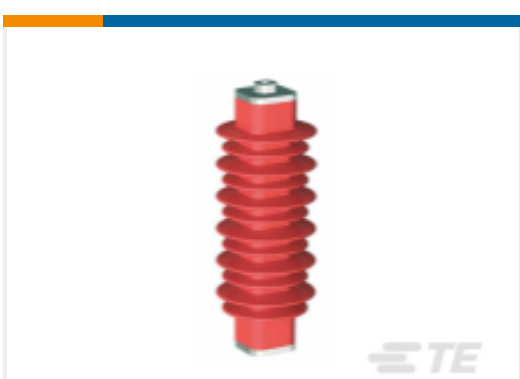
TE 产品编号EN6028-000 HDA-33M-B3-NFF