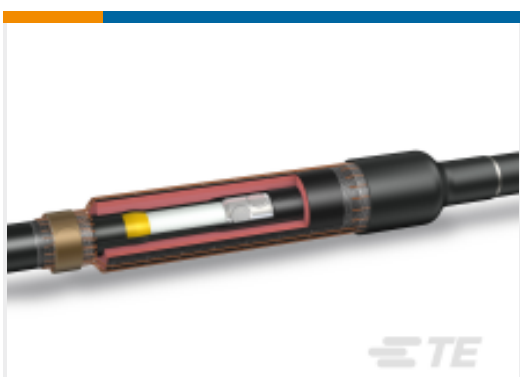
TE 产品编号E67139-069 POLJ-24/1X120-240