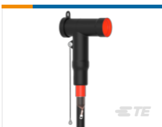
TE 产品编号CM0009-013 屏蔽式可分离连接器 1250 A