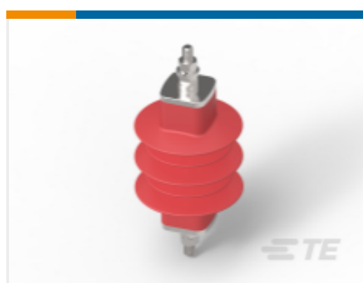
TE 产品编号EN7740-000 中压避雷器