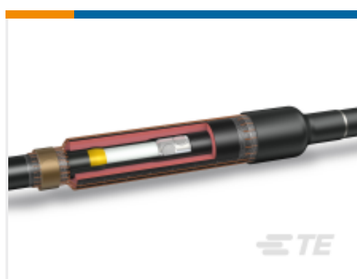
TE 产品编号D69547-000 POLJ-01/4X1-6(S10)