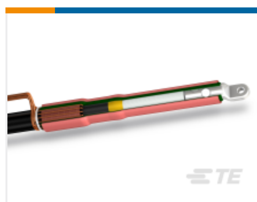
TE 产品编号914019-014 POLT-12D/1XI-L12A