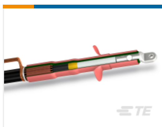
TE 产品编号349080-013 POLT-42E/1XI