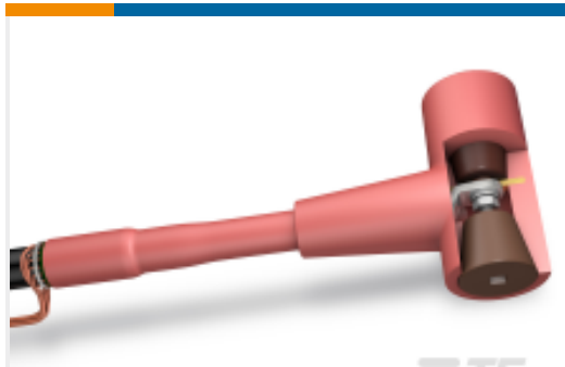
TE 产品编号555340-070 RICS-5123