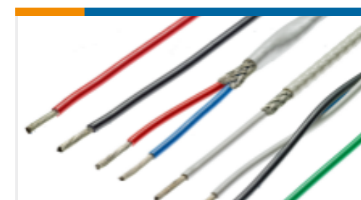
TE 产品编号109761-000 44A0141-20-9/90/92/96