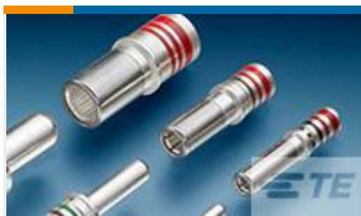
TE 产品编号 0662-207-0882 CONT SOC ASSY