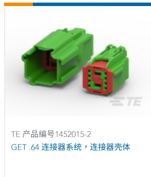
TE 产品编号1452015-2 GET .64 连接器系统, 连接器壳体