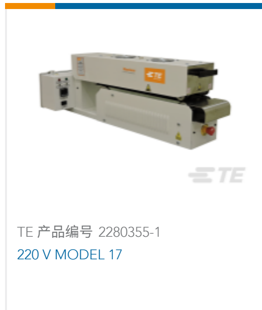
TE 产品编号 2280355-1 220 V MODEL 17