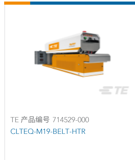
TE 产品编号 714529-000 CLTEQ-M19-BELT-HTR