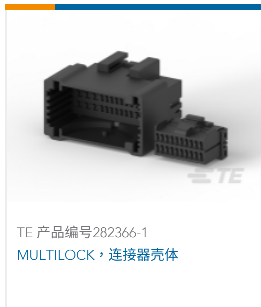
TE 产品编号282366-1 MULTILOCK, 连接器壳体