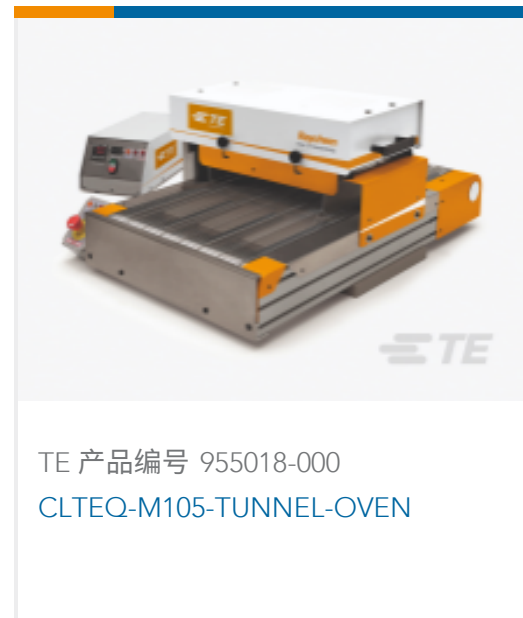
TE 产品编号 955018-000 CLTEQ-M105-TUNNEL-OVEN