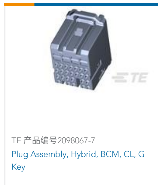
TE 产品编号2098067-7 Plug Assembly, Hybrid, BCM, CL, G Key