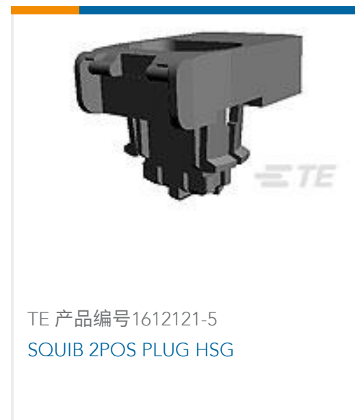
TE 产品编号1612121-5 SQUIB 2POS PLUG HSG