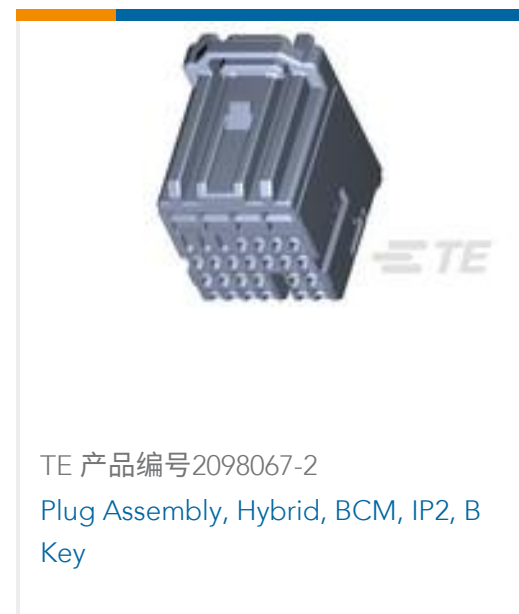
TE 产品编号2098067-2 Plug Assembly, Hybrid, BCM, IP2, B Key