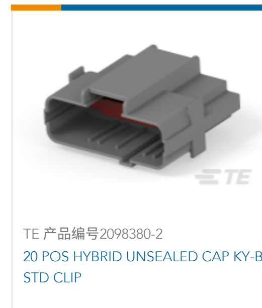
TE 产品编号2098380-2 20 POS HYBRID UNSEALED CAP KY-B STD CLIP