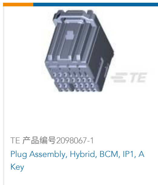
TE 产品编号2098067-1 Plug Assembly, Hybrid, BCM, IP1, A Key