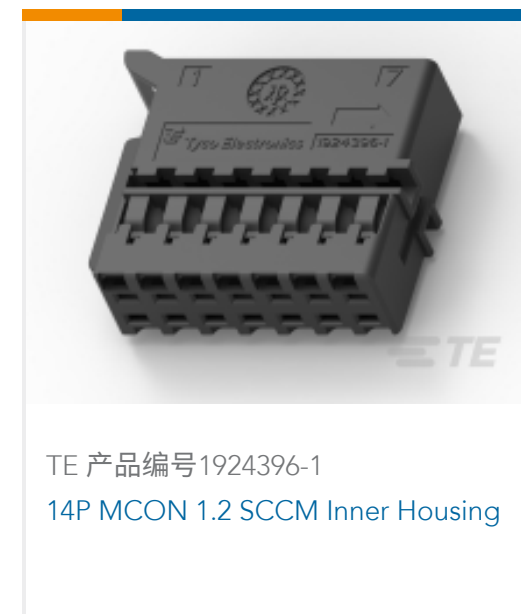
TE 产品编号1924396-1 14P MCON 1.2 SCCM Inner Housing