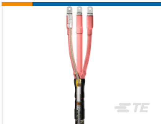
TE 产品编号A31452-070 GUST-12/70-120/800-L12