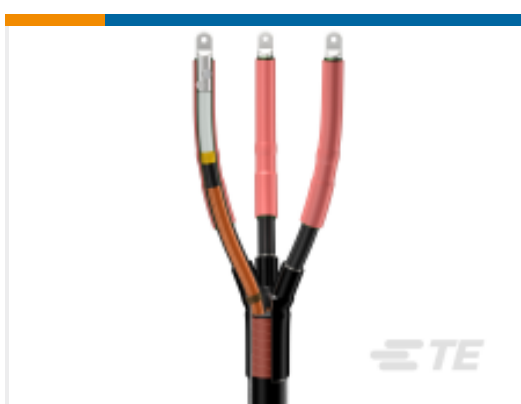
TE 产品编号E92435-063 POLT-12D/3XIH1