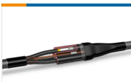
TE 产品编号A69078-064 POLJ-12/3X70-150