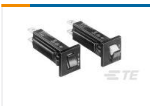
TE 产品编号3-1393250-1 W28-XQ1A-16=W28