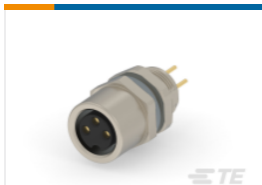
TE 产品编号T4043014031-000 M8.FMLE.PNLFRONT.3POS.STRPCB