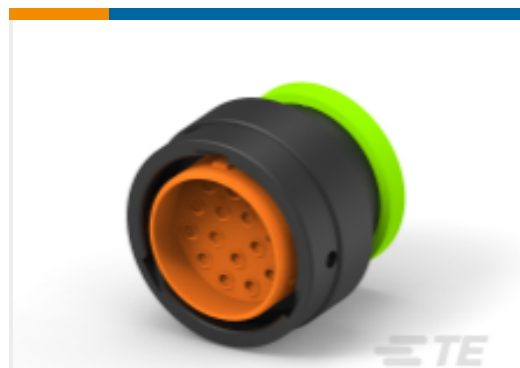
TE 产品编号HDP26-24-16PN-L017 PLG, 16P, BLK, N, RNG, 12, P