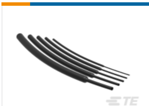
TE 产品编号A81736-000 RNF-100-BK 热缩管