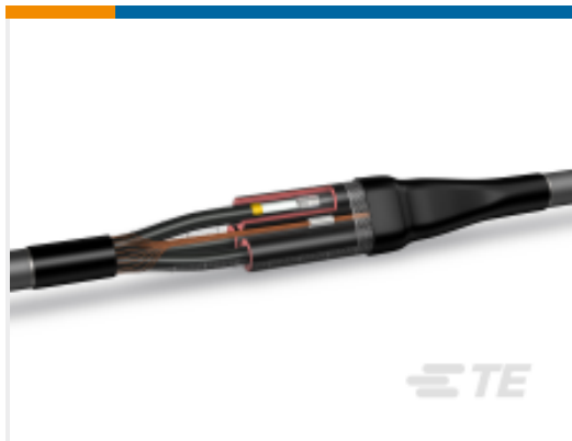
TE 产品编号D11309-070 POLJ-12/3X25-70