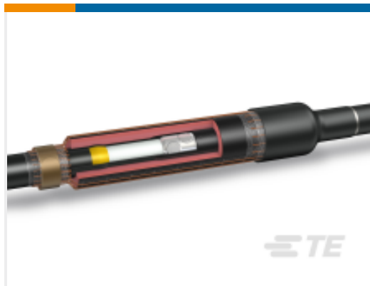
TE 产品编号E67139-069 POLJ-24/1X120-240