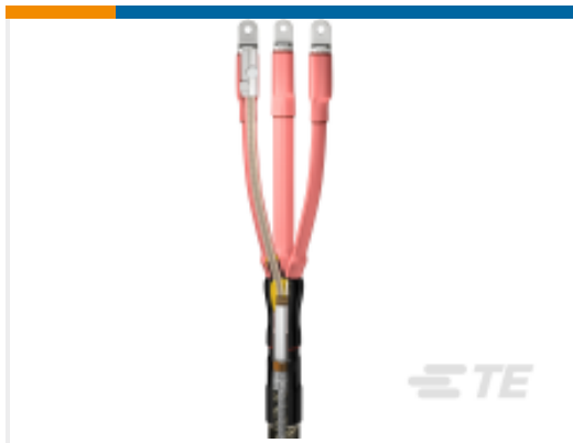
TE 产品编号C47372-064 GUST-12/25-50/800