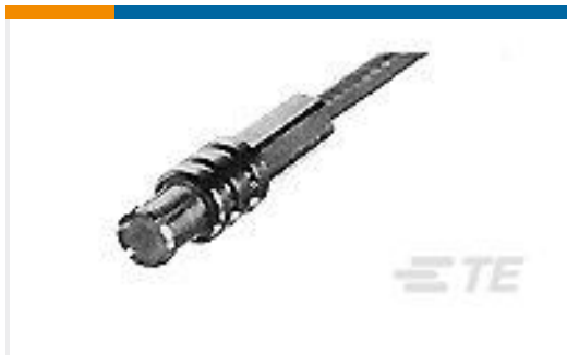
TE 产品编号1060875-2 MCX CABLE PLUG, CRIMP ATTACH