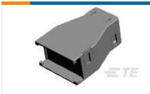
TE 产品编号1986185-1 Strain Relief,6 Posn,D5200 Dynamic, 2