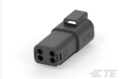
TE 产品编号1-2600030-0 4CCT BLACK RECEP W/LARGE SEAL