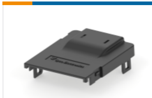
TE 产品编号1986186-1 Strain Relief,20 Posn,D3000 Dynamic, 2