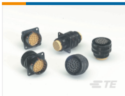
TE 产品编号ZPF000000000019919 FDDBA 57-14-19 PN-K-A499