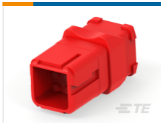
TE 产品编号D369-R99-AP1 矩形连接器, 9路母端