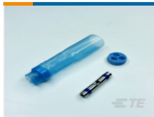
TE 产品编号CU3031-000 D-200-89