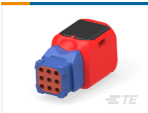
TE 产品编号YD369-P99-AP300000 Rectangular Connectors: 9-Way Plug