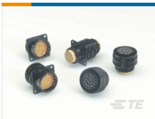
TE 产品编号ZPF000000000019909 FDDBA 57-14-15 SN-K-A499