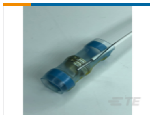
TE 产品编号EG7059-000 SO63-3-01CS4036