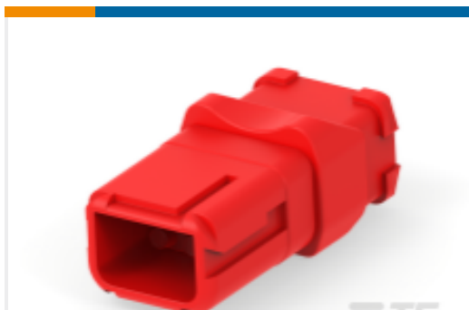
TE 产品编号D369-R66-AS0 矩形连接器, 6路母端