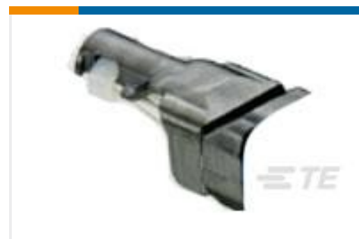
TE 产品编号D369-STB-6 369 6 WAY BACKSHELL STRAIGHT TIE WRAP