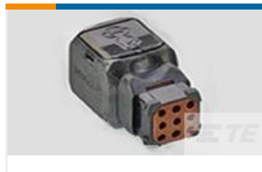
TE 产品编号D369-R99-NS0 369 9 WAY REC, NO CONTACTS, SKT