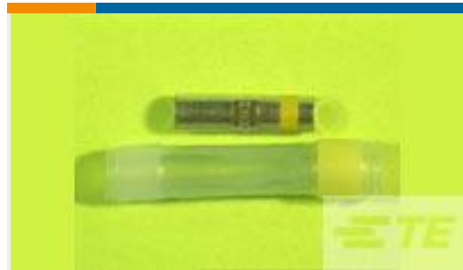
TE 产品编号650076-000 D-436-38