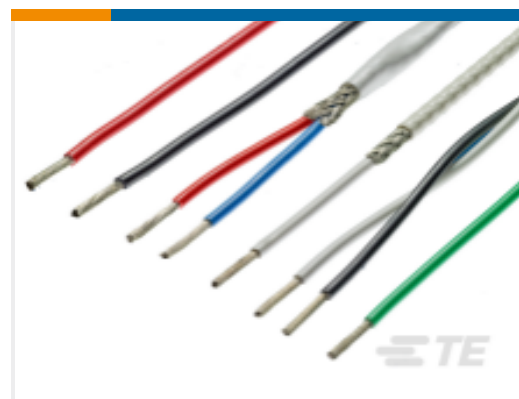
TE 产品编号301018-001 44AM1111-18-9-9