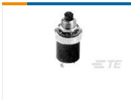
TE 产品编号1825516-1 MSP103B04