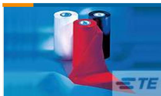
TE 产品编号691452-000 1330-0617-10