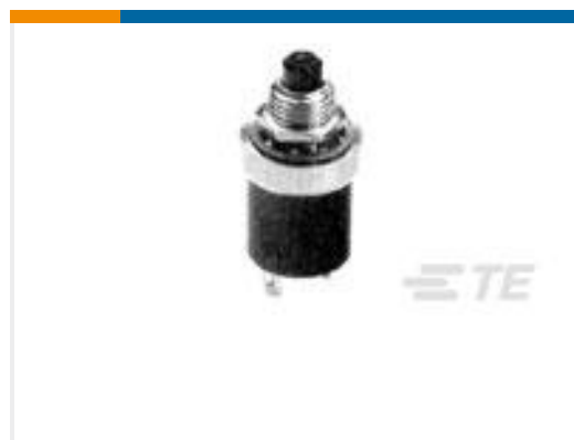
TE 产品编号1825516-3 MSP103C004