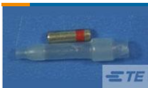
TE 产品编号650074N006 D-436-36CS454