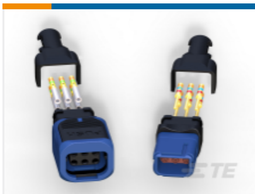
TE 产品编号YD369-P33-AS000000 369 3 WAY PLUG, NO CONTACTS, SKT