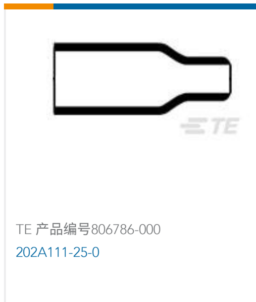
TE 产品编号806786-000 202A111-25-0