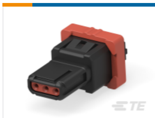
TE 产品编号 CAT-D369-B33 Rectangular Connectors: 3-Way Panel Mount, 90PCB