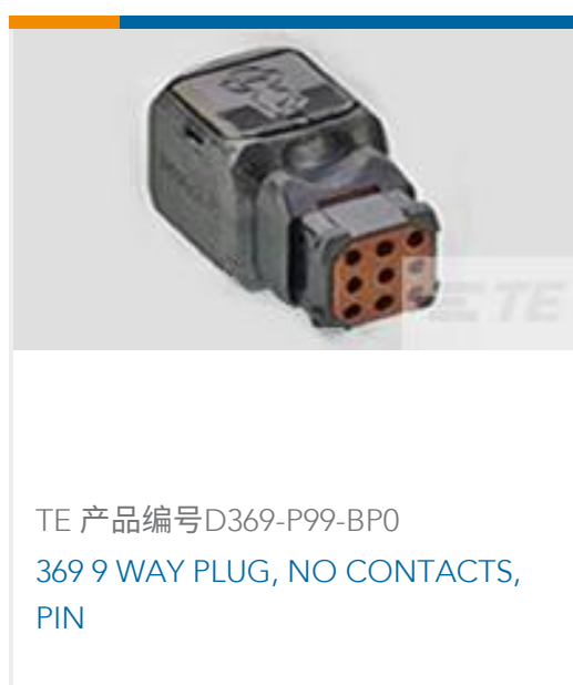
TE 产品编号D369-P99-BP0 369 9 WAY PLUG, NO CONTACTS, PIN