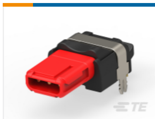
TE 产品编号 CAT-D369-G33 PCB Mount Receptacle: 3-Way Inline