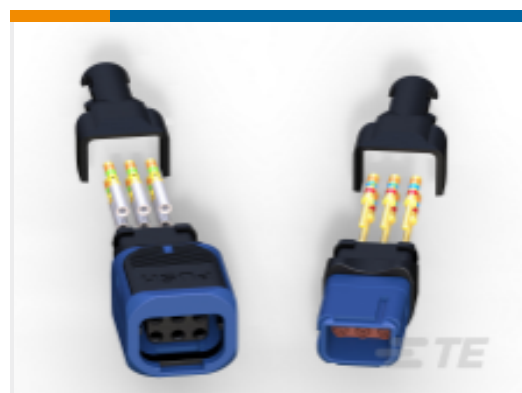
TE 产品编号 D369-R33-AS0 369 3 WAY REC, NO CONTACTS, SKT