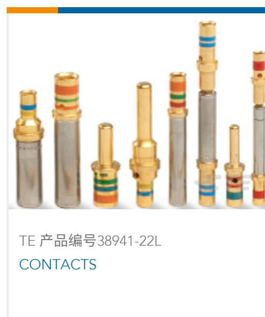
TE 产品编号38941-22L CONTACTS