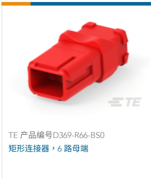
TE 产品编号D369-R66-BS0 矩形连接器, 6 路母端