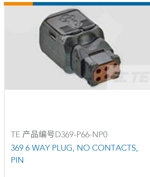
TE 产品编号D369-P66-NP0 369 6 WAY PLUG, NO CONTACTS, PIN