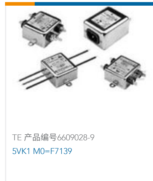
TE 产品编号6609028-9 5VK1 M0=F7139