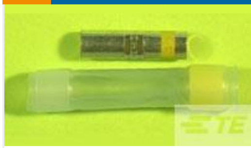
TE 产品编号695051-000 W-096-02