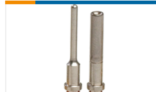
TE 产品编号ZPF000000000000432 006-1188-20