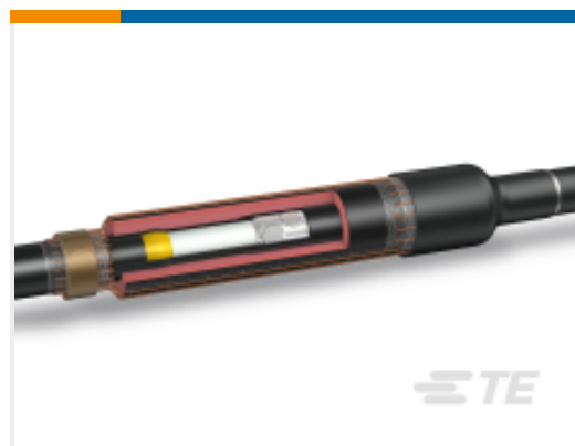
TE 产品编号E67139-069 POLJ-24/1X120-240