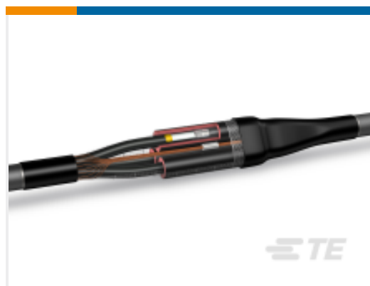
TE 产品编号D11309-070 POLJ-12/3X25-70