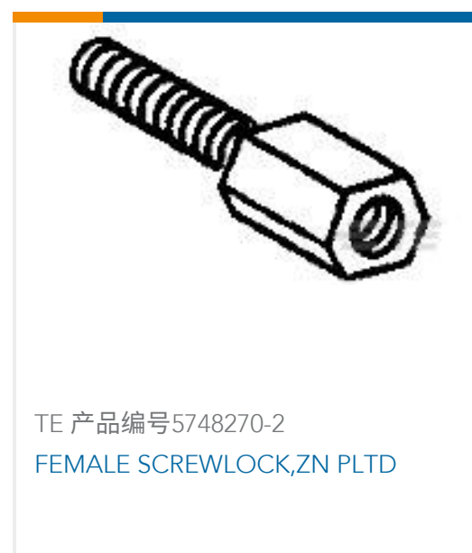
TE 产品编号5748270-2 FEMALE SCREWLOCK,ZN PLTD