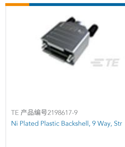
TE 产品编号2198617-9 Ni Plated Plastic Backshell, 9 Way, Str