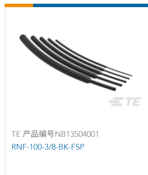
TE 产品编号NB13504001 RNF-100-3/8-BK-FSP