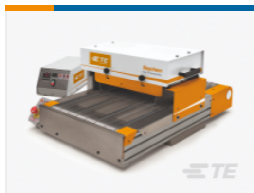
TE 产品编号 955018-000 CLTEQ-M105-TUNNEL-OVEN