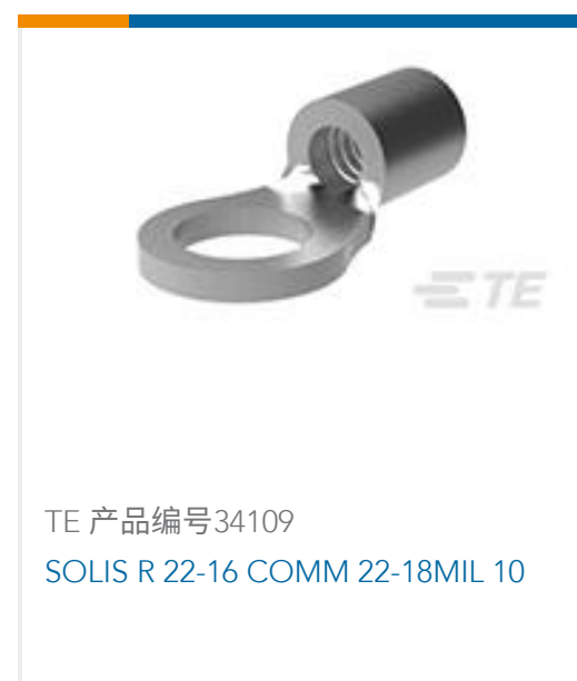
TE 产品编号34109 SOLIS R 22-16 COMM 22-18MIL 10