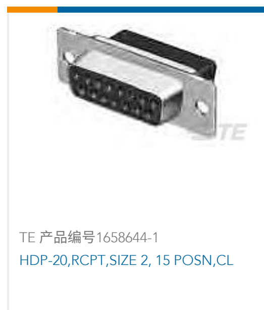
TE 产品编号1658644-1 HDP-20,RCPT,SIZE 2, 15 POSN,CL