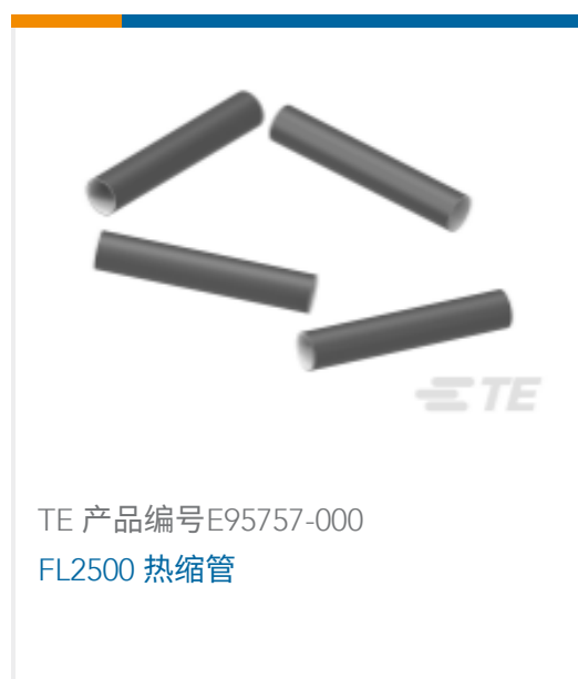
TE 产品编号E95757-000 FL2500 热缩管