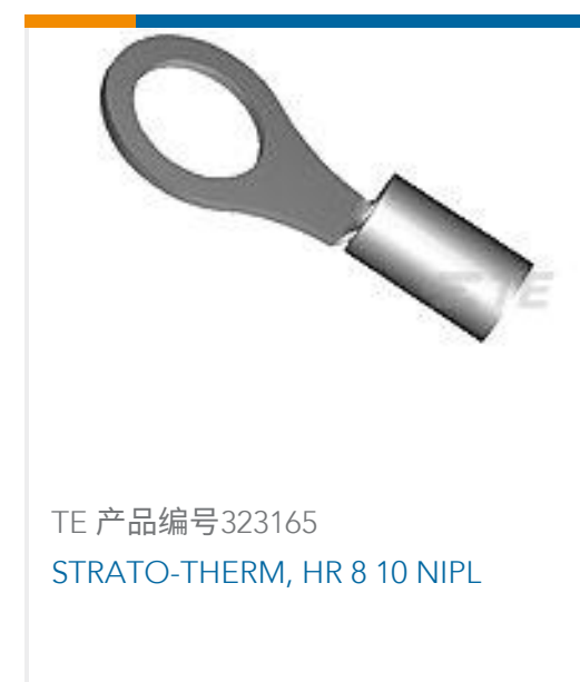
TE 产品编号323165 STRATO-THERM, HR 8 10 NIPL