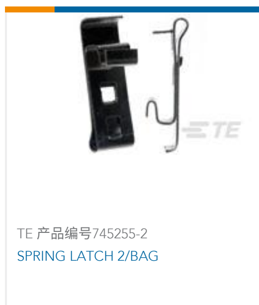
TE 产品编号745255-2 SPRING LATCH 2/BAG