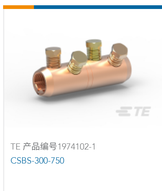
TE 产品编号1974102-1 CSBS-300-750