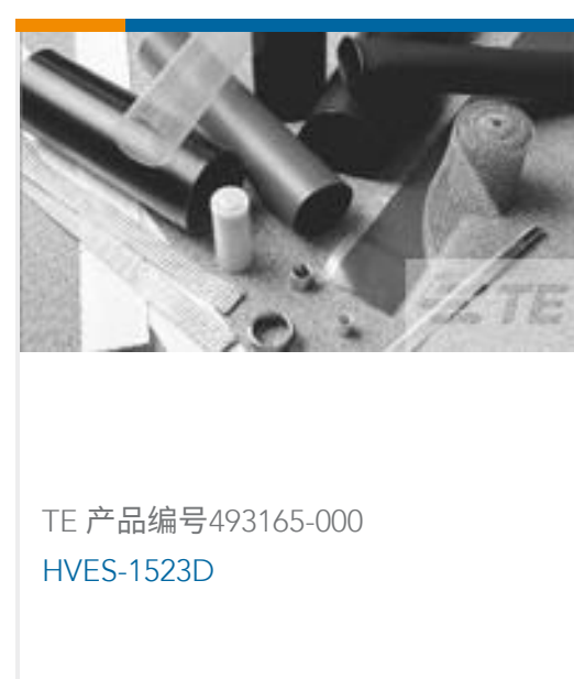
TE 产品编号493165-000 HVES-1523D