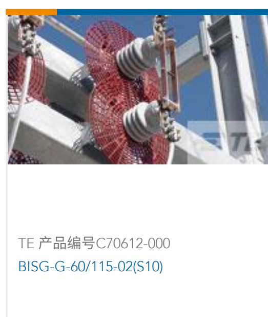
TE 产品编号C70612-000 BISG-G-60/115-02(S10)