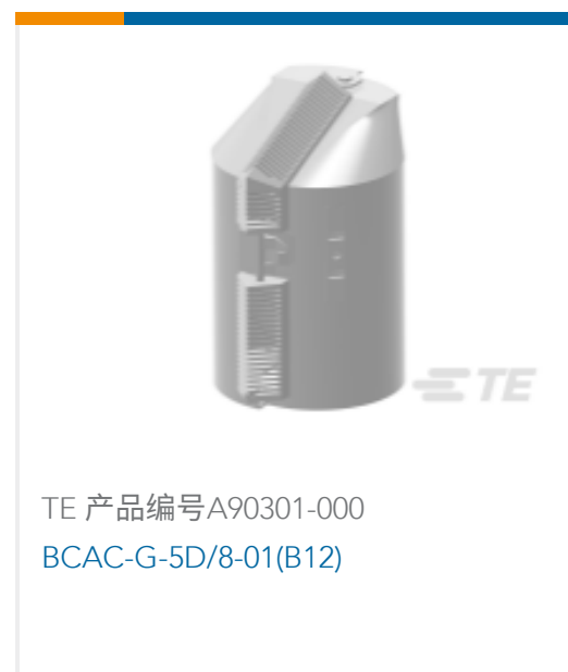
TE 产品编号A90301-000 BCAC-G-5D/8-01(B12)