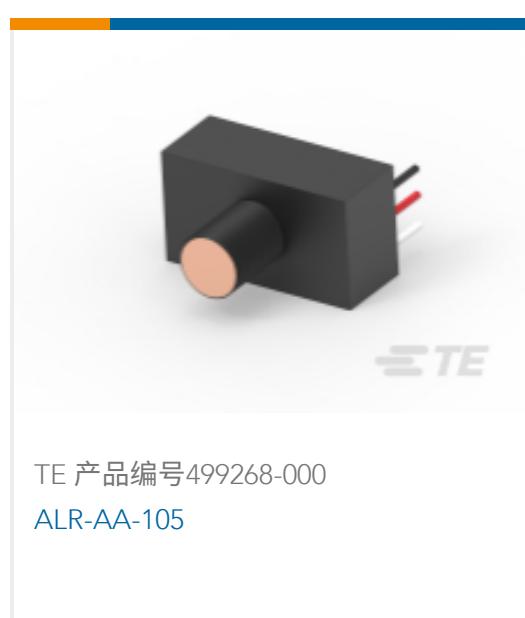
TE 产品编号499268-000 ALR-AA-105