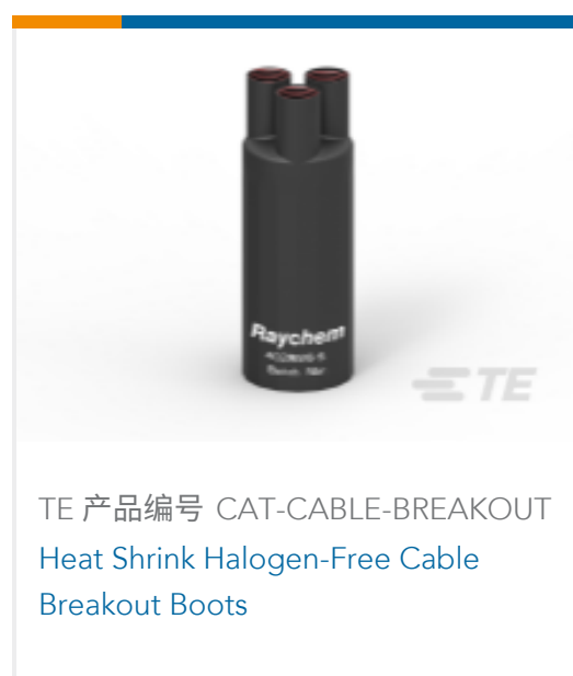
TE 产品编号 CAT-CABLE-BREAKOUT Heat Shrink Halogen-Free Cable Breakout Boots