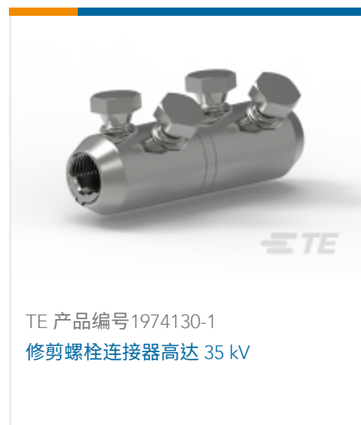
TE 产品编号1974130-1 修剪螺栓连接器高达 35 kV