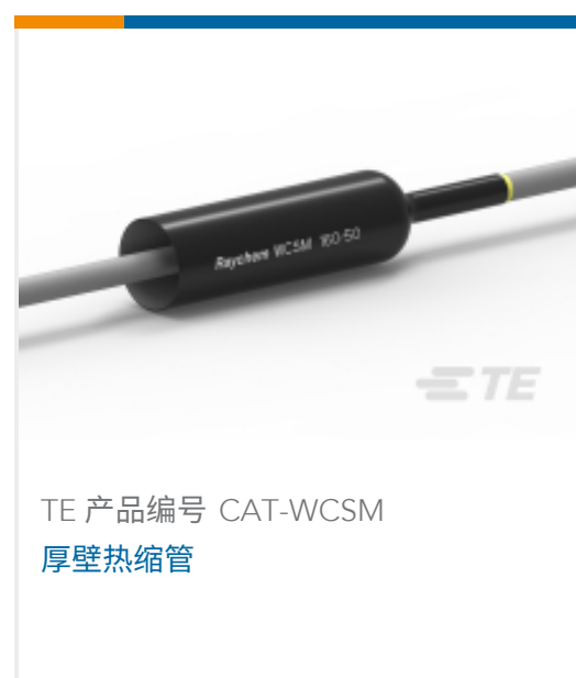
TE 产品编号 CAT-WCSM 厚壁热缩管