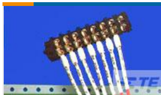
TE 产品编号2902090001 HT-SCE-1K-3/32-2.0-9