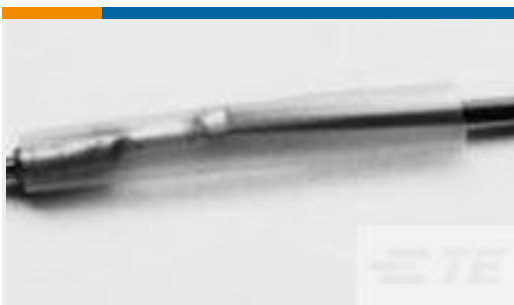
TE 产品编号CV37312001 RW-175-E-3/4-X-STK