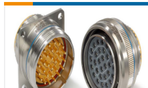
TE 产品编号ZPF000000000008281 983-6KE 22-55 PN-L