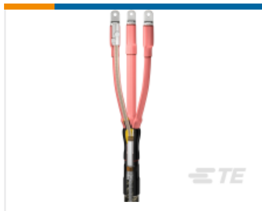
TE 产品编号A31452-070 GUST-12/70-120/800-L12