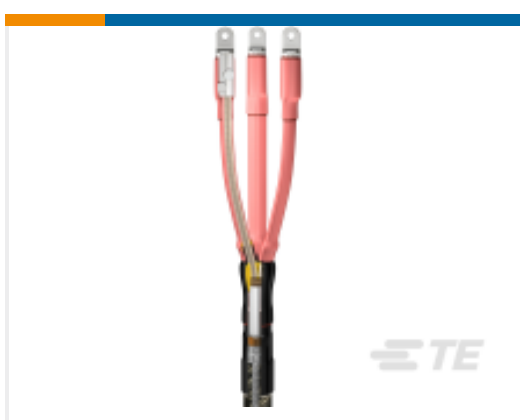
TE 产品编号C47372-064 GUST-12/25-50/800