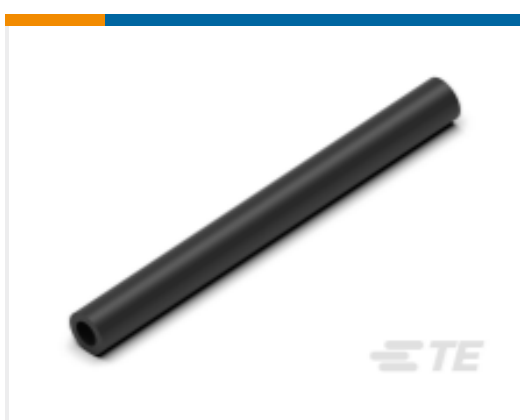
TE 产品编号CN5946-000 EN-CGAT-6/2-0-1200