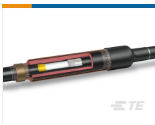
TE 产品编号E67139-069 POLJ-24/1X120-240