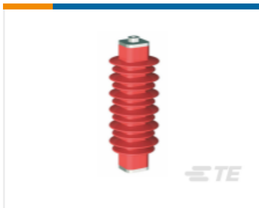
TE 产品编号EN6028-000 HDA-33M-B3-NFF