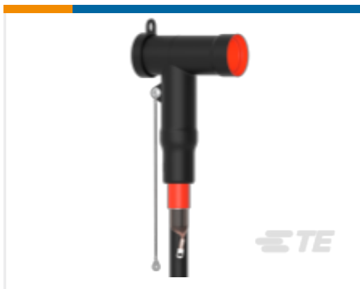
TE 产品编号CM0012-072 屏蔽式可分离连接器 1250 A