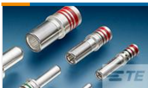
TE 产品编号 0662-207-0482 CONT SOC ASSY