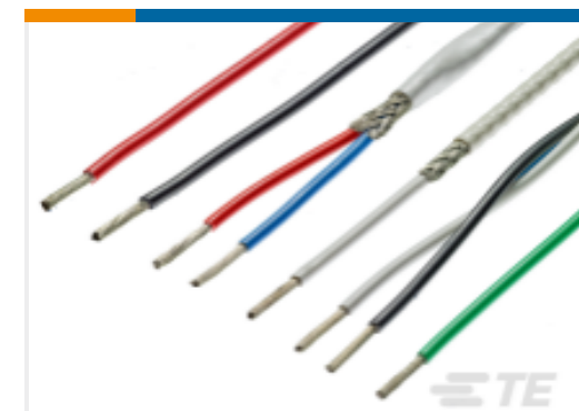
TE 产品编号067137-000 44AM1161-20-MST6-9CS2275