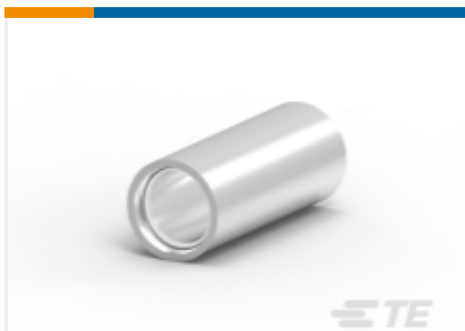
TE 产品编号1958510-1 SPLICE,STRATO-THERM, BUTT, HR, 2 AWG