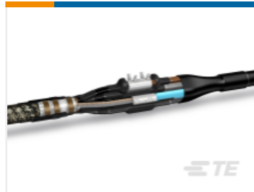
TE 产品编号CZ7578-000 LJTM-4X/035-150