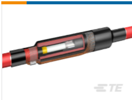
TE 产品编号691269-005 MXSU-3131