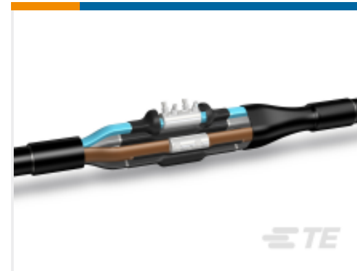
TE 产品编号CY1543-000 LJSM-4X035-150-PP