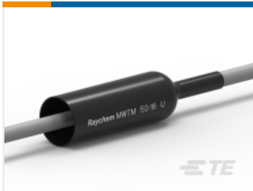
TE 产品编号385152-000 中厚壁热缩管